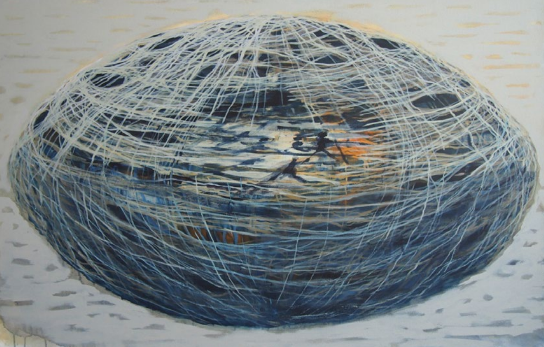
Erdball - Spielball / 2013 / Acryl auf Leinen / 100 x 150 cm

Seit Jahrzehnten untersucht Erich Spindler in seiner künstlerischen Praxis intensiv die menschliche Existenz und die sozialen Strukturen, die das Miteinander prägen.