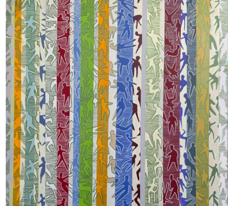
Wir durchleben verschiedene Zeiten / 2025 / Acryl auf Leinen | 100 x 100 cm

tionen zu erkennen und wertzuschätzen, während sie gleichzeitig die Komplexität menschlicher Beziehungen und deren Auswirkungen auf die Umwelt in den Fokus rückt.