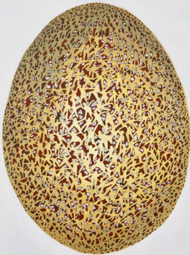
Ich denke an die Zerbrechlichkeit und male ein Ei 2018 / Acryl auf Leinen / 140 x 100 cm

Das Ei als Ursprungssymbol des Lebens wird zur Projektionsfläche für das menschliche Dasein. Die durchbrochene Oberfläche steht sinnbildlich für die Zerbrechlichkeit unserer Existenz. In einer Welt, in der das Individuum zwischen Freiheit und Abhängigkeit oszilliert und Stabilität stets prekär ist. Die menschlichen Figuren, eng ineinander verschlungen, zeigen: unser Leben ist nur im Miteinander denkbar – und im Bruch offenbar.