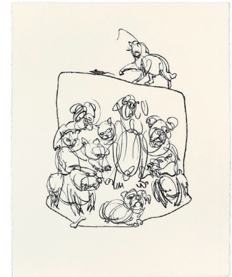
JAHRESGABE 2020/21 ALEXANDER FASEKASCH „The Gang“ Tiefdruck

+43 (0)732 / 77 98 68 +43 (0)660 / 22 47 050 info@diekunstschaffenden.at