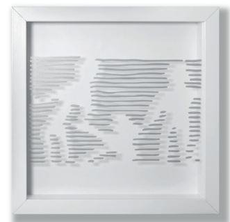
JAHRESGABE 2018 ERICH SPINDLER „Verbindungen“ Folie auf Acrylglas