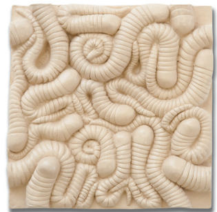
JAHRESGABE 2019 KATINKA DIETZ „Made im Rapport“ Steinzeug-Fliese